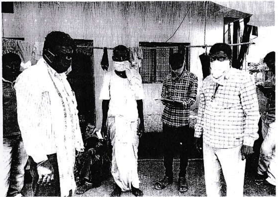
कोविड सर्वे अंतर्गत एका ग्रुपची तैारी समई