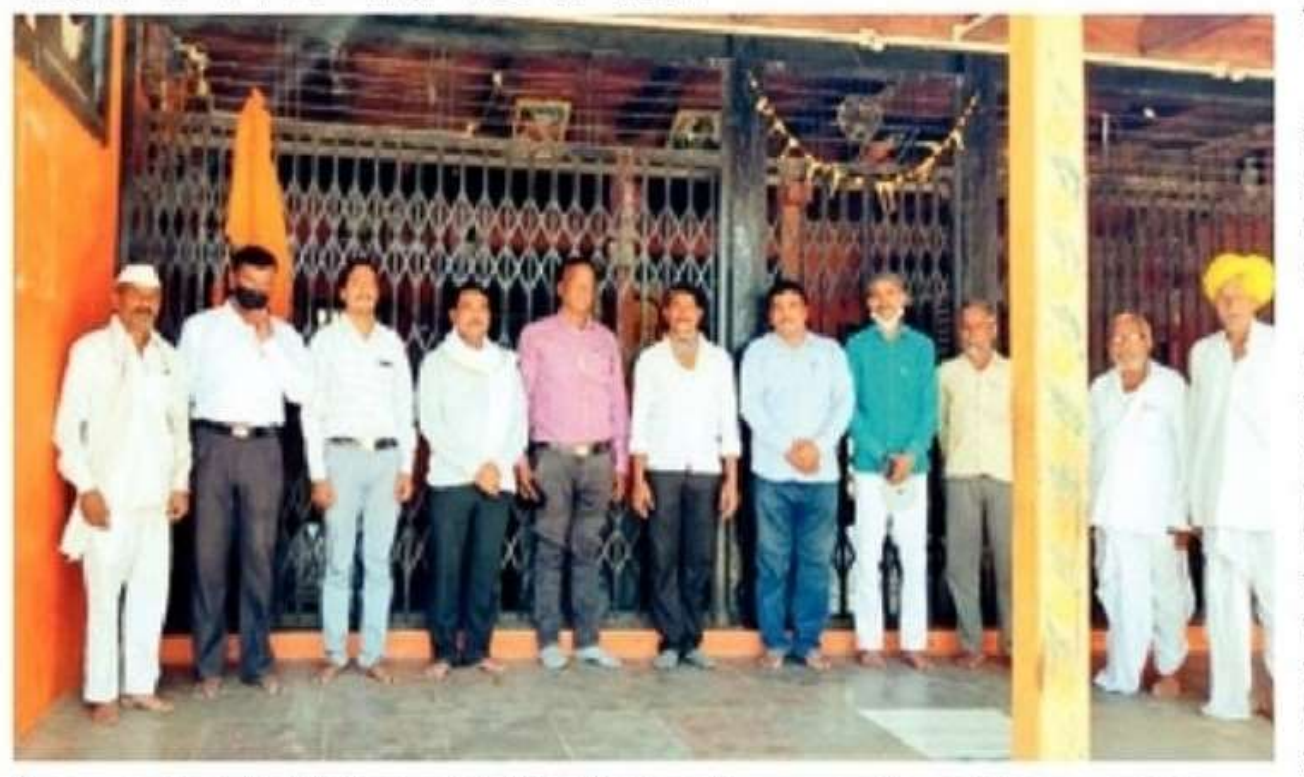
सेलू तालुक्यातील बोरिकनी येथील हेमाडपंथी नृसिंह मंदिराची पाहणी करण्यात आली. या प्रसंगी अभ्यास गटाचे पथक.