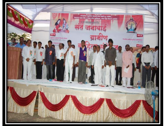
१० /१२/२०१६ पहिले संतजनाबाई ग्रामीण मराठवाडा साहित्यसंमेलन गंगाखेड.